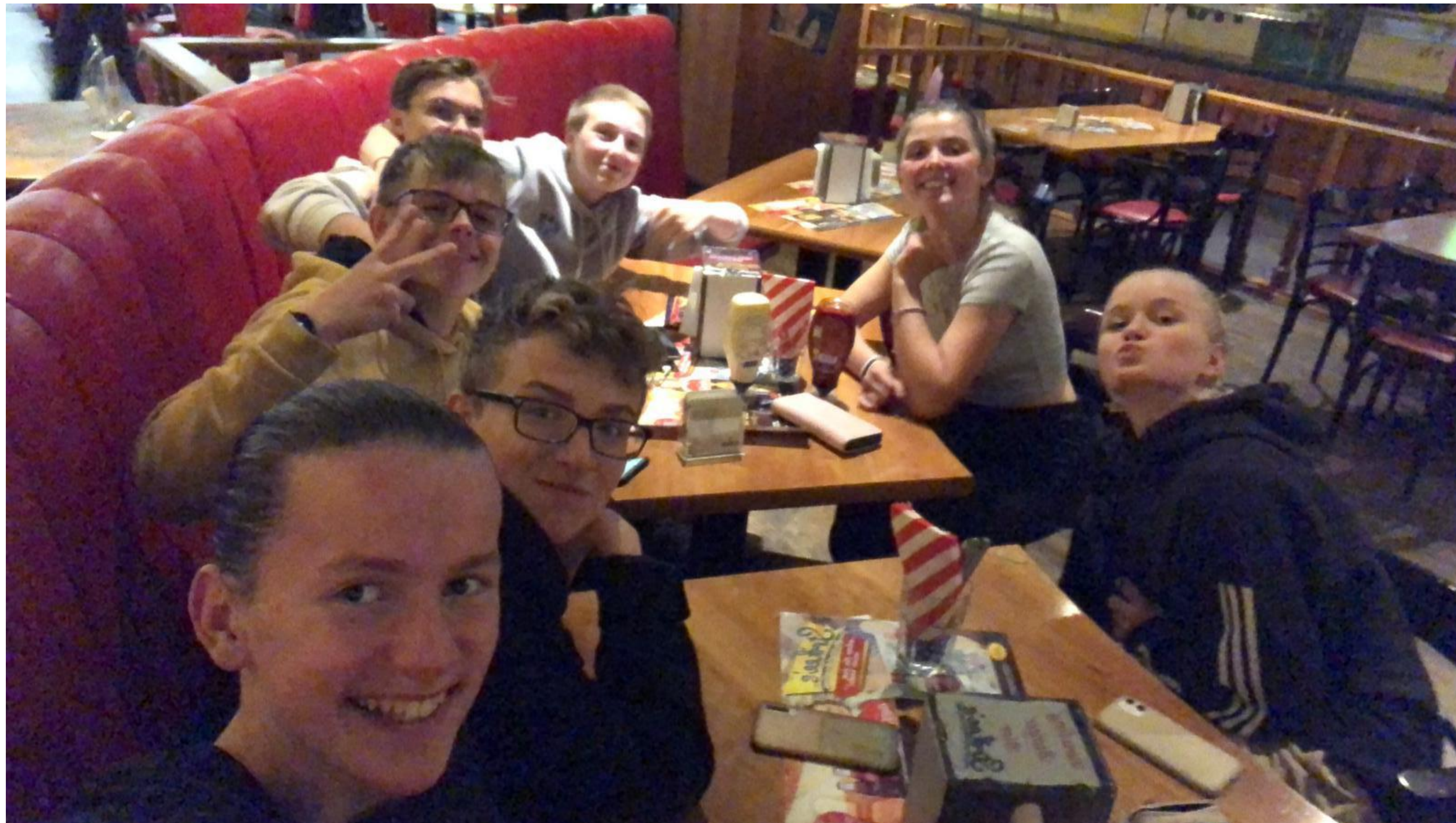
Večer v Strikees – Treffen im Strikees